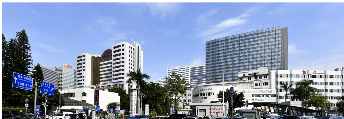
深圳市人民医院（院本部）

医院现有四个院区（院本部、一门诊、龙华分院、坂田院区）和一个转化医学协同创新中心，目前占地面积16.8万m 2 ，建筑面积34.3万m 2 ，编制病床3200张，开放病床3060张，现有在岗员工5143人。2021年医院总诊疗人次392.97万人，其中门诊人次344.27万人，急诊人次46.89万人，出院人次13.13万人，住院手术操作10.31万次。建院以来，医院门急诊量、出院人次和手术量始终位居全市医疗机构前列，是深圳市规模最大、历史最久、综合救治能力最强的公立医院。