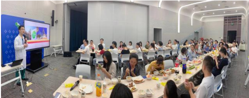
▲ 住培医师高桌晚宴（High Table Dinner）