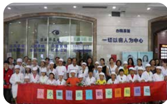
小小眼科医生职业体验活动