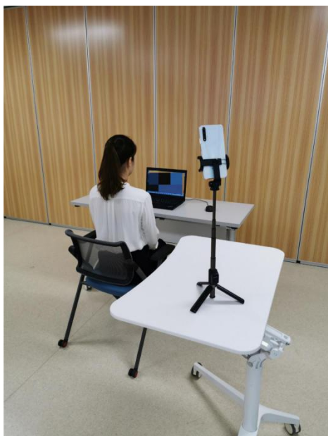
考生面试设备（含摄像头、话筒、扬声器）及侧面摄像头位置图