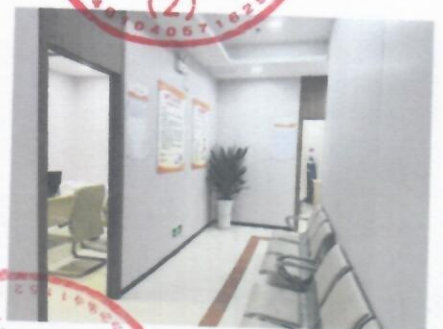
产科科室门牌及整洁等候区