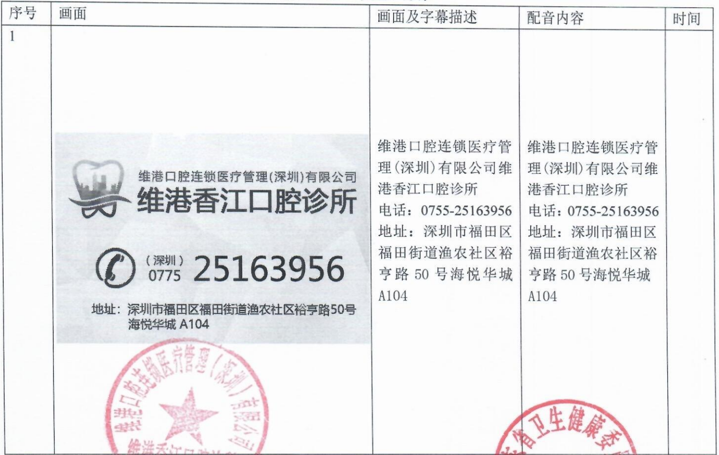
镜头 1: 清晰图